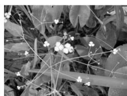
沢瀉・サジオモダカの花